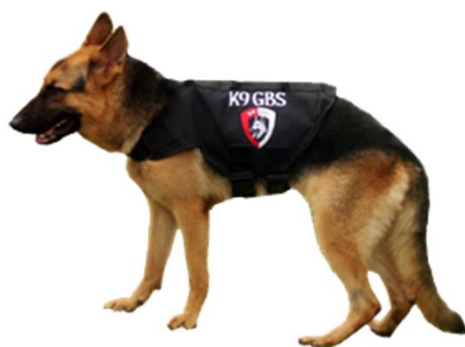
German shepherd Dog / Herder Nama : BRUNO Jenis Kelamin : Jantan Tinggi : 60 cm Berat : 40 kg