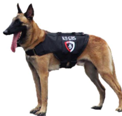
Belgian Malinois Nama : HUGOS Jenis Kelamin : Jantan Tinggi : 60 cm Berat : 35 kg